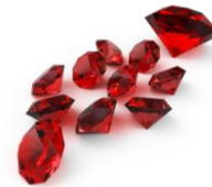
Robijnen en koraal

Haar waarde gaat die van robijnen ver te boven.